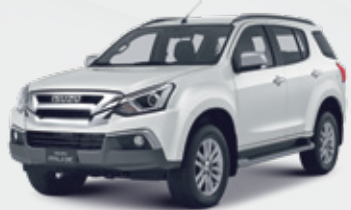
Silky White Pearl أبيض لؤلؤي حريري