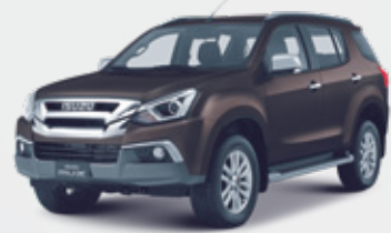
Havana Brown Mica بني غامق لَمَاع