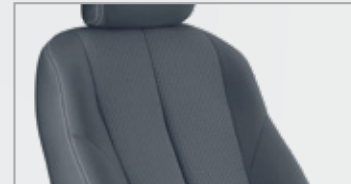
Black Cloth من القماش الفاخر باللون الأسود