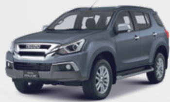
Obsidian Gray Mica رمادي حجري لَمَاع