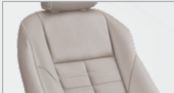
Beige جلدية بلون البيج