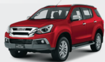
Red Spinel Mica أحمر لَمَاع