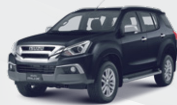
Cosmic Black Mica أسود داكن لَمَاع