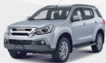
Titanium Silver Metallic تيتانيوم معدني